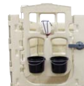
Tür und Futterstation in der Höhe einstellbar.