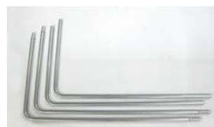
Pro und Deluxe Rohrrahmen 4-teilige Version, leicht zu versenden, einschließlich Verbindungszubehör. Kompatibel für Model Pro, Pro II, Deluxe und Deluxe II.