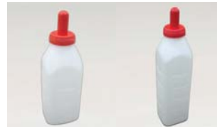
Tränkeflasche mit Nuckel In 2 und 3ltr. Version sowie Ersatz-Nuckel verfügbar.