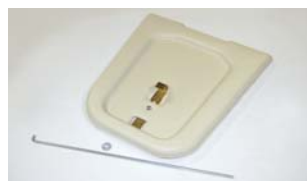
Deluxe II Futterklappe Kompatibel mit Pro II und Deluxe II.