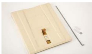
Deluxe Futterklappe Nicht kompatibel mit Pro II und Deluxe II.