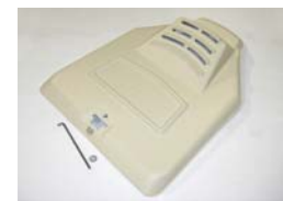
Pro II und Deluxe II Einstreuklappe Kompatibel mit Pro II und Deluxe II.