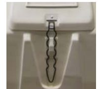
Stabiler und leicht bedienbarer Türverschluß