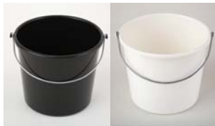
-Plastik Eimer 9,5 ltr. stabile Ausführung, lebensmittelecht.