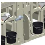
Pen System Abweiser Stabiler, doppelwandiger Abweiser verhindert Tierkontakt zwischen zwei Boxen.