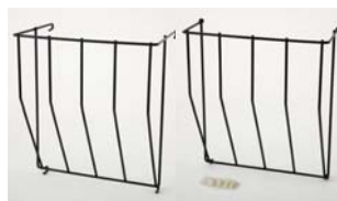
Heuraufe zur Montage am Standardzaun oder in der Hütte Pulverbeschichtet mit Befestigungsmaterial.