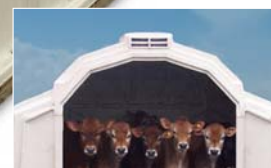
Für 4-6 Kälber, bis zu 6 Monate.

Besuchen Sie uns unter www.Calf-Tel.com .