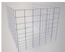
Standard-Zaun ohne, mit einer oder zwei Fütterungsöffnungen. 107cm x 103cm x 122cm