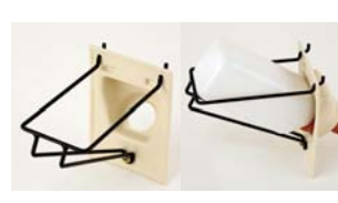
Flaschenhalter zur Montage an der Hütte, am Pen-System oder am Standard-Zaun Verfügbar in der 2 oder 3 ltr. Version.