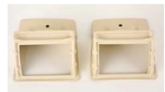
Pro und Deluxe First-Lüftungsklappen-Set Nicht mit Pro II und Deluxe II kompatibel.