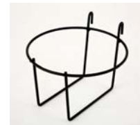
Eimer-Halter zur Montage am Standard-Zaun Pulverbeschichtet.