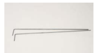
L-Stäbe Verbinden Hütte und Standard-Zaun, enthält 2 verzinkte L-Stäbe je Set.