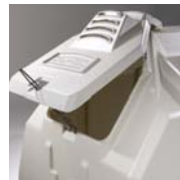
Optimale Belüftung Komplett einstellbare große Belüftungsklappe.