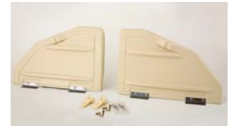
MutiMax Belüftungsklappen – Set Enthält 2 Belüftungsklappen mit Scharnieren, Verschlüssen und Befestigungsmaterial.