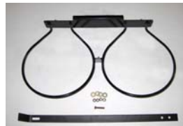
Doppel-Eimer-Halter zur Innenmontage Pulverbeschichtet für Model Deluxe und Deluxe II.