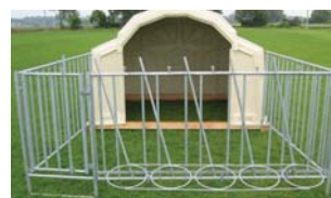
Stabil, komfortabel, praxisingerecht und tiergerecht! Abmessungen: 2m (4m...), 2,8m, Höhe 1,2m