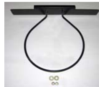
Eimer-Halter zur Innenmontage Pulverbeschichtet für Model Deluxe und Deluxe II.