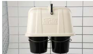
Eimer-Abdeckhaube Schützt Futter vor Niederschlag und Vögel. Eimer und Eimerhalter separat bestellen.