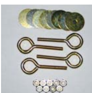
Ösenschrauben Set zur Zaunbefestigung Enthält: (4) Ösenschrauben, verzinkt, (8) Karosserie-Scheiben, (8) Muttern.