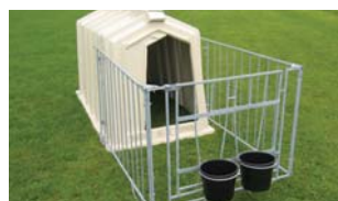
Stabil, komfortabel, praxisingerecht und tiergerecht! Länge ~1,8m x Breite 1,2m x Höhe 1,08m