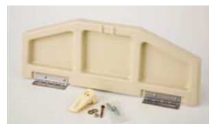
Pro and Deluxe Belüftungsklappe Enthält Belüftungsklappe, (2) Scharniere und Befestigungsmaterial. Nicht mit Pro II und Deluxe II kompatibel.