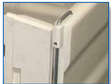
Freistehende, im Systemverbund steckbare Wandelemente