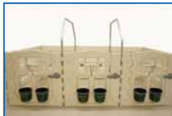
Schnelle und einfache Umrüstung von der Einzelbox zur Gruppenhaltung.