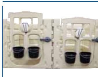
Höhe der Tür verstellbar