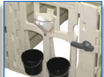
Leichter Zugang zu Futter